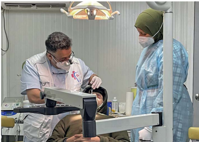
Die Zahnstation in einer alten Fabrikhalle auf dem Lagergelände ist sehr gut ausgestattet.

Wir konnten wundervolle junge Menschen aus dem Lager gewinnen, uns bei der Übersetzung in die Sprachen Arabisch, Farsi und Somali zu helfen und sich gleichzeitig auch ein wenig in zahnärztlicher Assistenz schulen zu lassen. Vormittags kann das ärztliche Team jederzeit bei seinen Hausbesuchen, zum Beispiel in das Quarantänelager, begleitet und unterstützt werden.