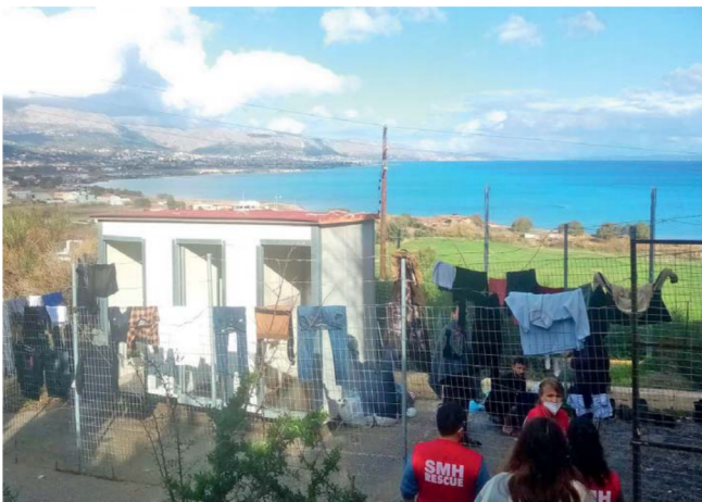
Am Vormittag kann das ärztliche Team bei seinen Hausbesuchen in das Quarantänelager begleitet und unterstützt werden.

Seit der Eröffnung im Juli konnten wir im Reception and Identification Centre of Chios – kurz RIC Vial – über 650 Patienten behandeln. Fast jede Woche ist ein Team vor Ort. In aller Regel bleiben die unentgeltlich arbeitenden Kolleginnen und Kollegen ein oder zwei Wochen, aber auch Langzeitaufenthalte von bis zu sechs Wochen gab es schon. Die Zahnstation befindet sich in einer alten Fabrikhalle auf dem Lagergelände. Morgens wird der Container der Station von den Gesundheitsbehörden für psychologische Untersuchungen genutzt. Deshalb ist eine Behandlung erst ab 16 Uhr möglich. Behandelt wird dann bis etwa 21 Uhr. Alle Patienten werden vor der Behandlung auf Corona getestet, um das Risiko einer Ansteckung so gering wie möglich zu halten.